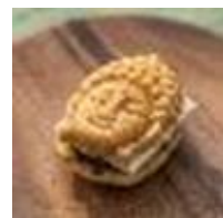
「あみにょん」 酪農王国(株) (R4)