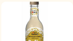
(株)柳屋本店 だしサイダー