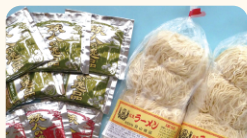
(有)羽山商店 お中元・お歳暮等贈り物用 「生ラーメンセット」