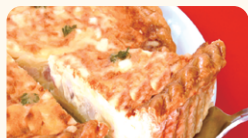
(有)レキップ・ド・ニコ ぶじのくにプレミアムキッシュ