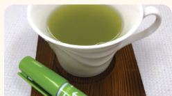
有限会社浅原工業 好きだっ茶 (お茶ペン)