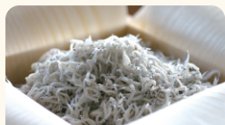
(有)カネ吉水産 厳選港釜揚げしらす・ 桜えびセット