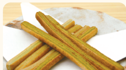
するが夢倶楽部 カリッとしずおがスイーツ