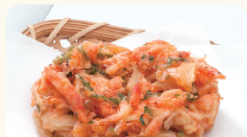
原藤商店 桜えびのかき揚げ・揚げ玉