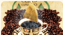
(有)トクナコーヒー 富士山溶岩焙煎珈琲ハッグ