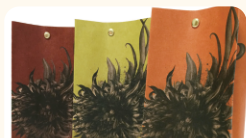
カネロク松本園 世界農業遺産最高位認定 “元祖国産燻製茶”