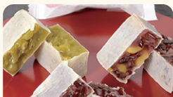
(有)又一庵 きんつば