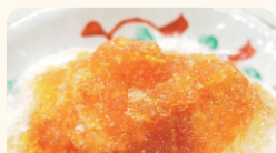
(株)高柳製茶 静岡県産紅茶シロップ