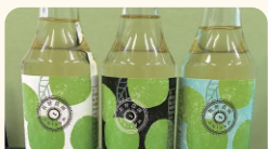
牧野農園 農家発! 新感覚ドリンク 「アラミカンスカッシュ」