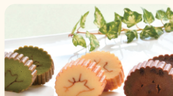
(有)丸生食品 ふんわり、しっとり。 伊達巻スイーツ