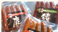
尾州真味屋総本舗 静岡ジビエウインナー各種 (鹿・鹿子ヨリソー・猪)