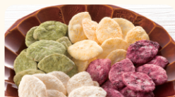
(有)おたけせんべい本舗 藤枝市の農産物を使用した スイーツ煎餅