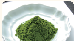
茗広茶業(株) 駿府の熟成石臼抹茶