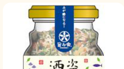
(株)カネヤマ水産 熟成の旨みを皆様に 酒盗とつびんぐ