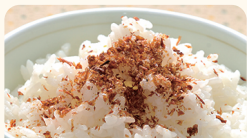
もえしよくプロジェクト 静岡支部 富士山かつおぶしのふりかけ