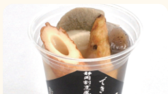
(株)丸又 冷やしカップおでん