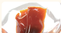
焼津水産化学工業(株) テアフラビン配合ゼリー