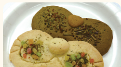
(株)ベルエキップ・プラス 幸せ猫サブレ