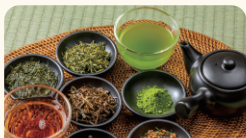
(株)マルヒデ岩崎製茶 お茶屋のおだし