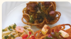
昭和ミート(株) 焼きそばネスト