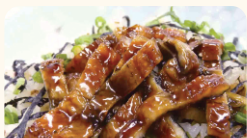
焼津冷蔵(株) キザミ洞穴子