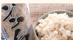
川島米穀店 圧倒的に美味しい! 無洗米の玄米・玄氣