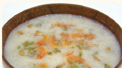
(株)カネジヨウ 桜えびのどろどろ玄米粥スープ