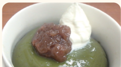
山梨罐詰(株) ほっとなとりん抹茶スイーツ