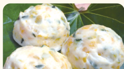
(株)はの字食品 介護・保育の食に地元の幸を 県産野菜とお魚の揚げボール