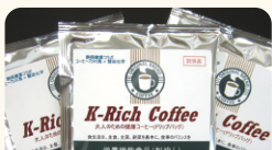
磐田化学工業(株) クエン酸カリウム配合 ドリップコーヒー