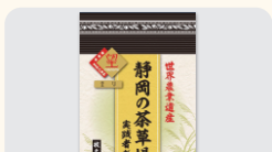
(株)荒畑園 静岡の茶草場農法実践者が 作ったお茶! 望金印