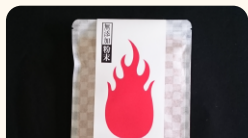
(株)マルツマエダ商店 燻し粉かつお