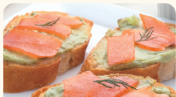
(株)田丸屋本店 チーズとわさび漬のマリアージュ カマンベール WASABI