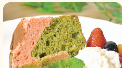
梅辰(株) ふわふわ 梅ちやふあん