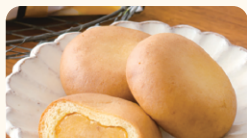
(株)玉華堂 みかん饅頭 陽の恵み