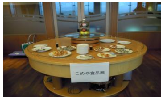
<フーズ・サイエンスセミナー交流会 企業出展コーナー>