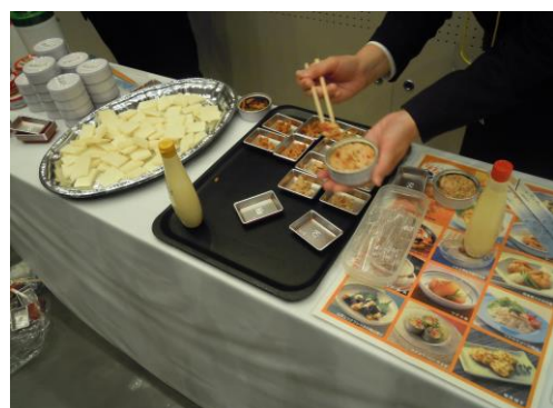
<フーズサイエンスセミナー交流会 企業出展コーナー>