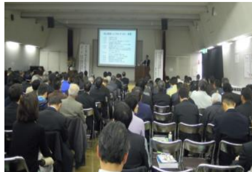
<フーズサイエンスセミナー 風景>