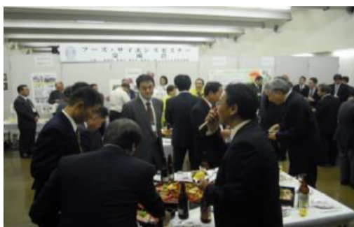
<フーズ・サイエンスセミナー交流会 風景>