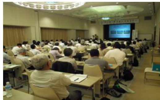
<フーズ・サイエンスセミナー風景>