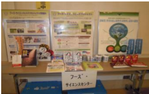
<フーズ・サイエンスプロジェクト事業展示>