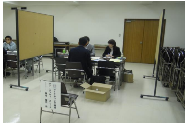
<マーケティング相談会風景>