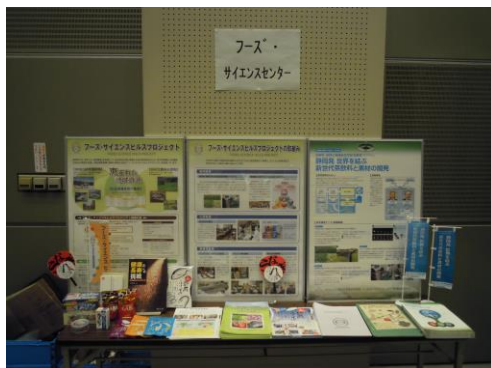
<フーズ・サイエンスプロジェクト事業展示>