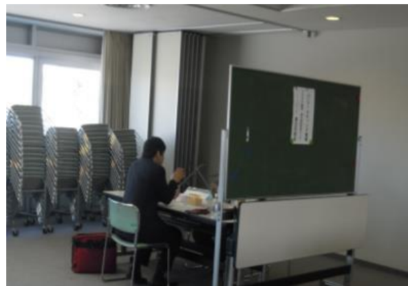
<マーケティング相談会風景>