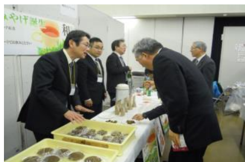
<フーズサイエンスセミナー交流会 企業出展コーナー>