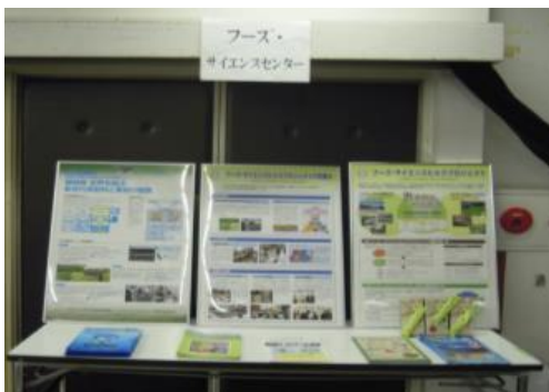
<フーズ・サイエンスプロジェクト事業展示>