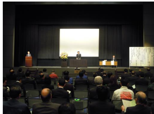
<フーズサイエンスセミナー 風景>