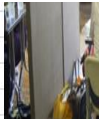
<マーケティング相談会風景>