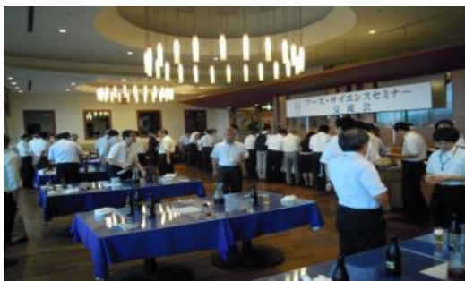
<フーズ・サイエンスセミナー交流会 風景>