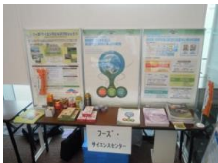
<フーズ・サイエンスプロジェクト外事業展示>