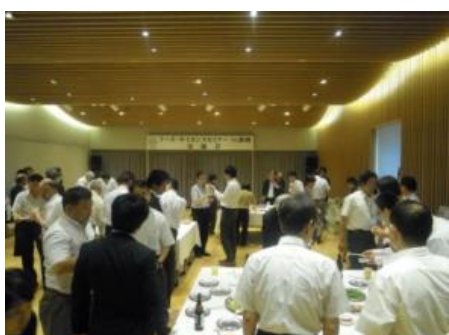
<フーズ・サイエンスセミナー交流会 風景>