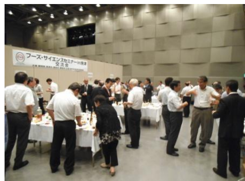
<フーズ・サイエンスセミナー交流会 風景>