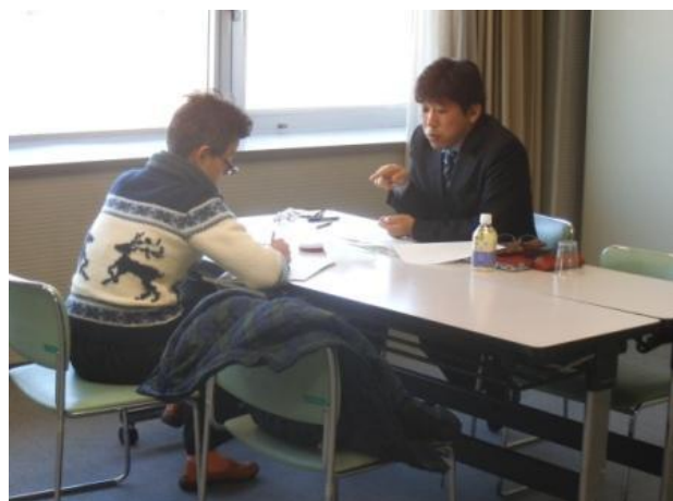
<マーケティング相談会風景>