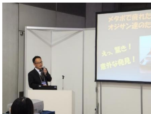
<(株)新丸正による企業プレゼンテーション>