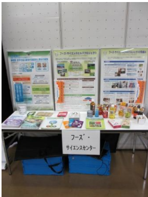
<フーズ・サイエンスプロジェクト外事業展示>