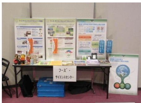
<フーズ・サイエンスプロジェクト事業展示>