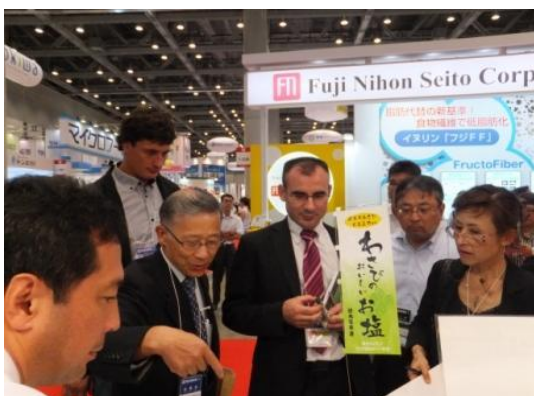
<フレンチフードクラスター来訪>