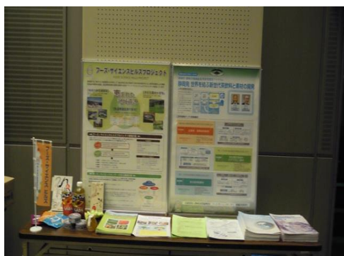
<フーズ・サイエンスプロジェクト事業展示>