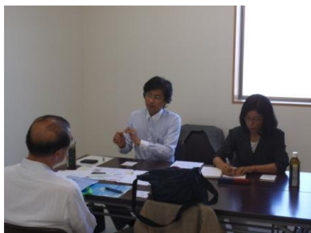
<マーケティング相談会風景>