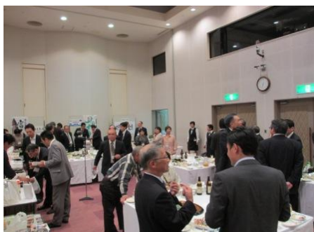
<フーズ・サイエンスフォーラム交流会 風景>