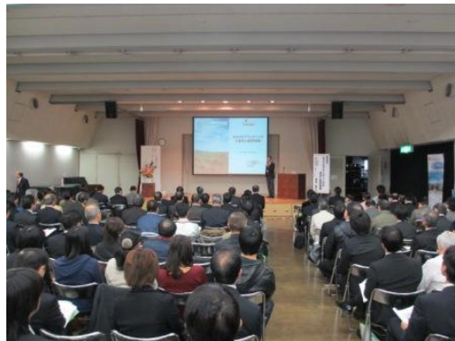
<フーズサイエンスセミナー 風景>