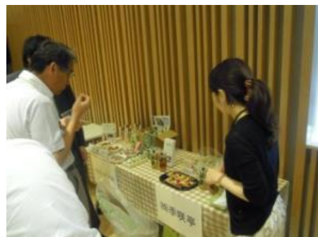
<フーズサイエンスセミナー交流会 企業出展コーナー>