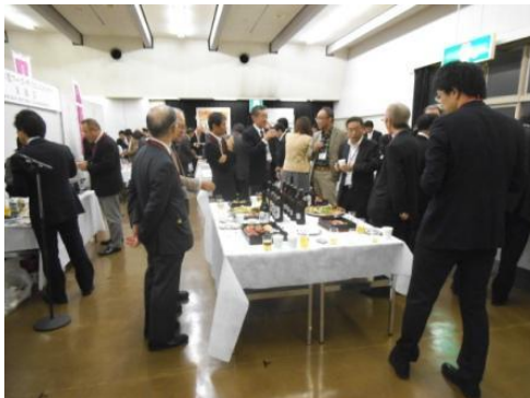
<フーズ・サイエンスセミナー交流会 風景>