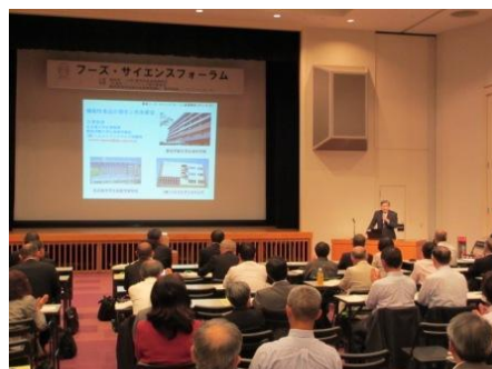
<フーズ・サイエンスフォーラム 風景>