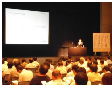
<フーズサイエンスセミナー 風景>