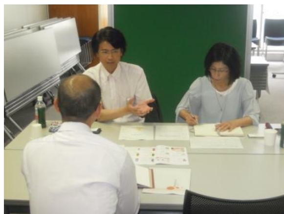
<マーケティング相談会風景>