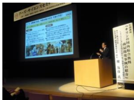
<フーズサイエンスセミナー 風景>